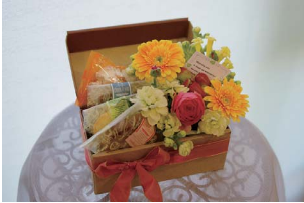
スイートボックス A ¥2,500 (焼き菓子5個 + アレンジメント)