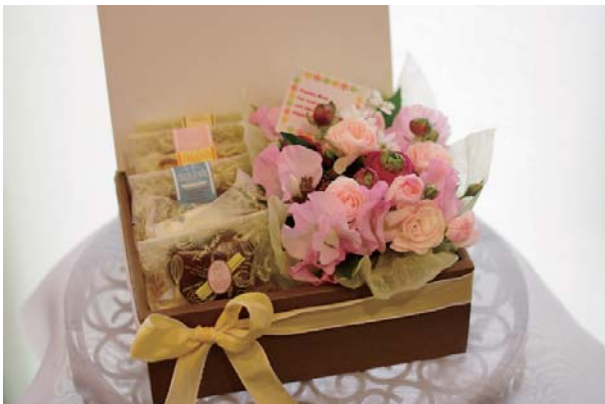
スイートボックス C ¥3,500 (焼き菓子9個 + アレンジメント)

『スイートボックス』は、ご予約商品です。 お作りするまでに、最低3日かかります。 裏面のお申し込み欄に必要事項をご記入の上、 お買い求めください。 (写真はサンプルです。アレンジメントは 季節のお花でお作りします。)