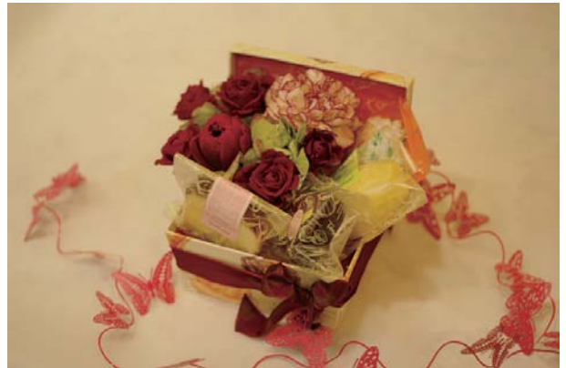
スイートボックス B ¥3,000 (焼き菓子7個 + アレンジメント)

ご自宅でのティーパーティーなどにも 『スイートボックス』はいかががでしょうか。 アレンジメントとスイーツがテーブルに 彩りを添えてくれます。